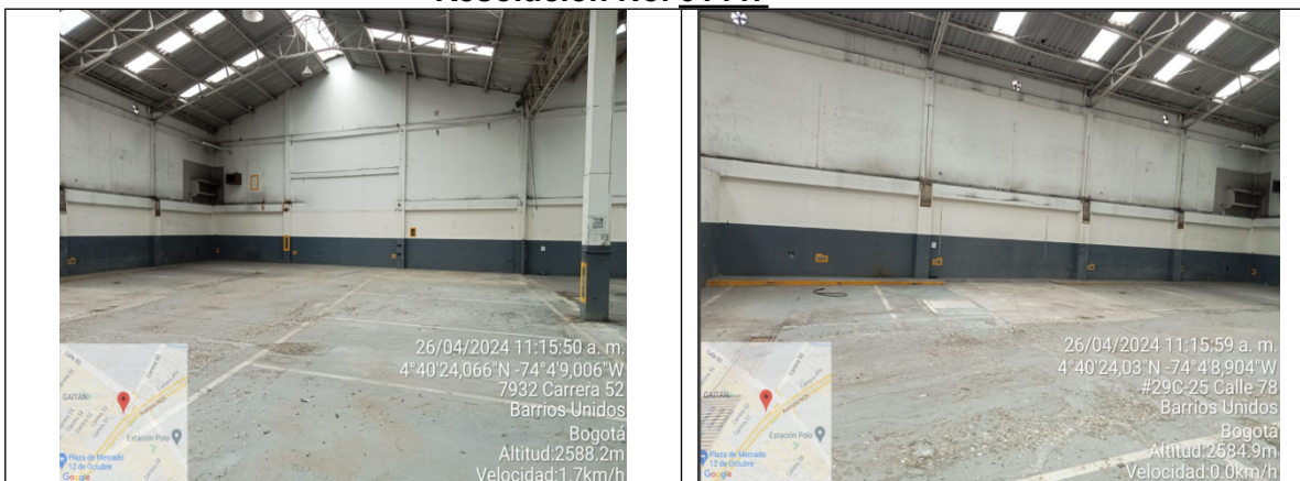
Fotografía 7 y 8. Vista interna del predio