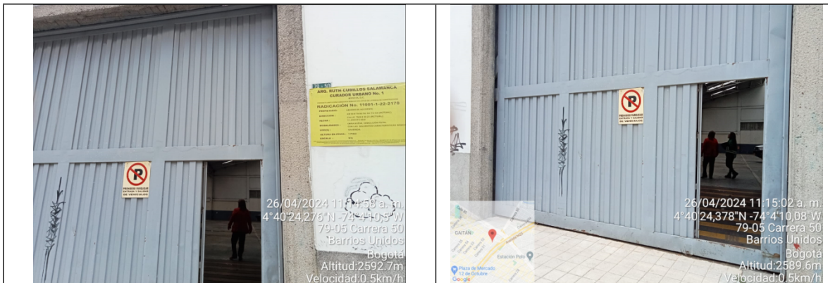
Fotografía 1 y 2. Entrada principal de la bodega (Carrera 50 # 79 - 56)