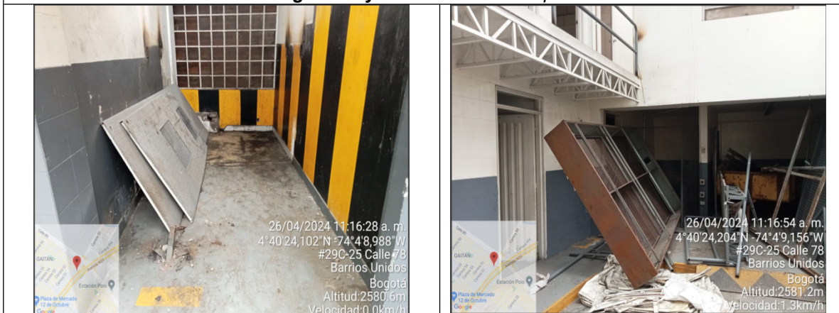
Fotografía 9 y 10. Almacenamiento de estructuras metálicas y de madera