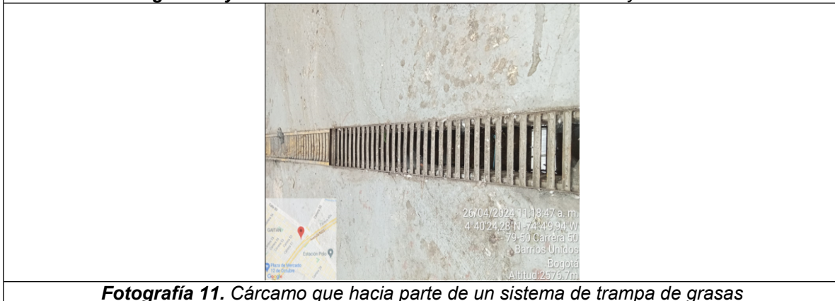
Fotografía 11. Cárcamo que hacia parte de un sistema de trampa de grasas