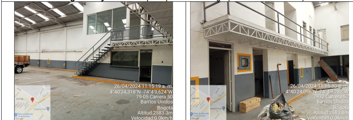
Fotografía 3 y 4. Antiguas oficinas ubicadas en el predio